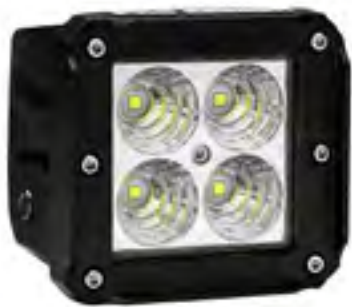
Арт. 883059 Для установки на сноубайк необходима специальная крепежная площадка. 2883659 либо 2883060

GPS трекер совмещенный с приборной панелью мотоцикла. Он позволяет записывать маршрут, редактировать его и делится маршрутом с друзьями, а так же отслеживать температуру двигателя, температуру окружающей среды, расстояние, напряжение, направление по компасу, угол подъема и обороты двигателя. 2,7-дюймовый экран использует самые современные технологии для лучшего просмотра даже под прямыми солнечными лучами.