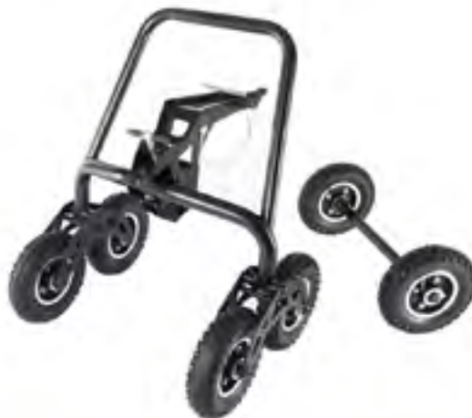
Арт. 2883062 Pivot Dolly Не подходит для Mountain Horse Spindle