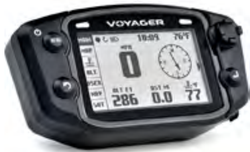
Арт. 2883008 Для установки необходима специальная крепежная площадка 2883058 либо 2883659