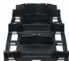
Timbersled® Convex ARO 129 Track

Для универсальности применения сноубайка к нему можно приобрести дополнительный комплект гусениц с другими параметрами , что позволит сочетать преимущества двух характеристик в одной технике, а так же к ним можно приобрести другую лыжу, коньки к лыже и так далее, что поможет увеличить вариативность выбора и лучше подготовить сноубайк к трассе