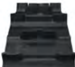
Timbersled® Ripper 93 Track