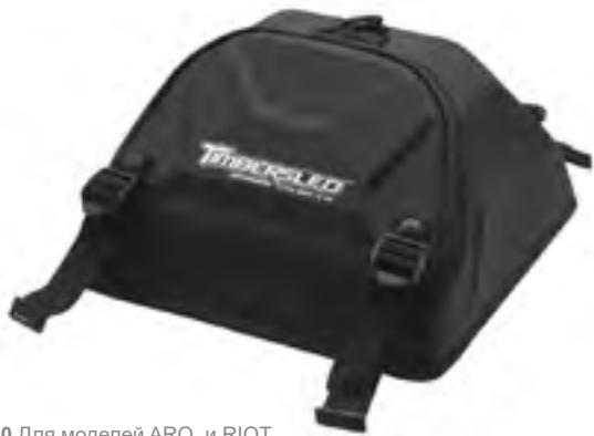
Арт. 2884310 Для моделей ARO и RIOT

Сумка-кофр крепится к передней части туннеля сноубайка и благодаря нашей новой системе быстрого крепления, позволяющей быстро закреплять и снимать сумку. Специальный материал, из которого изготовлена сумка-кофр сохраняет снаряжение сухим и защищенным от непогоды при проезде через самые сложные снежные трассы.