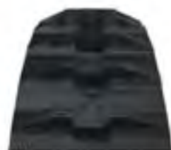
Timbersled Ripper 90 Track by Camso