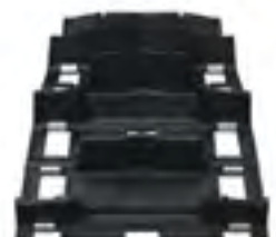
Timbersled Convex ARO 137 Track