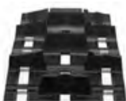
Timbersled Convex Mountain Horse 137 Track by Camso