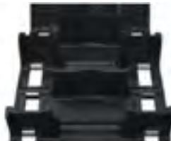
Timbersled® 3" 129 Track