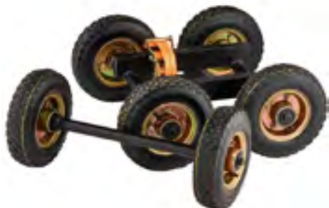
Арт. 2882851 Mountain Horse All Terrain Wheel Set Разработан специально для Mountain Horse