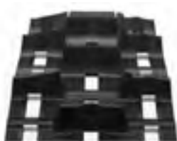
Timbersled Convex Mountain Horse 120 Track by Camso

Универсальный комплект для подключения термостата предназначен для мотоциклов различных моделей и марок, не оснащенных термостатом с завода. В комплект термостата входит сам термостат в собственном корпусе (рабочая температура 82 градуса), комплект фитингов, специальный шланг и комплект крепежа. Этот комплект подходит для большинства брендов, таких как KTM, Yamaha, Kawasaki и Honda, а также других производителей. В комплект входит универсальная инструкция по установке.