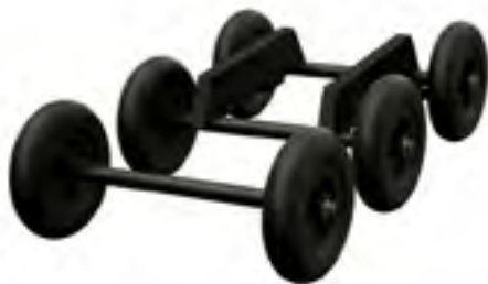
Арт. 2883433 ARO All Terrain Wheel Set Подходит для систем ARO и RIOT

Используйте нашу поворотную тележку, чтобы легко маневрировать или загружать сноубайк в любое время. Просто установите сноубайк на предлагаемый комплект, согласно приложенной инструкции по эксплуатации, и все готово к транспортировке.