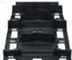
Timbersled Convex ARO 120 Track